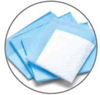
منتجات النظافة الصحية والمنسوجات الطبية