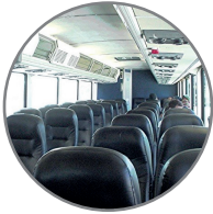
المقصورات الداخلية للطائرات والحافلات

يمكن استخدامها كإضافة عام للروائح، بما في ذلك الروائح الناتجة عن التعفن أو العفن الفطري.