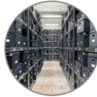
صناديق تخزين المستندات