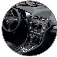
لوحات العدادات ومساند الأذرع وحاملات الأكواب