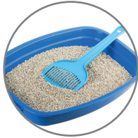
صناديق فضلات القطط