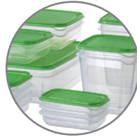
حاويات تخزين الطعام