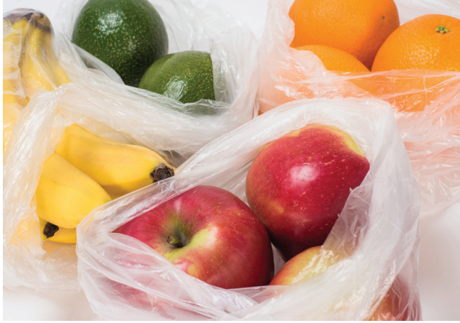
تعبئة وتغليف المواد الغذائية

يحتوي على 80% من مواد طبيعية غير مستمدة من مصادر أحفورية